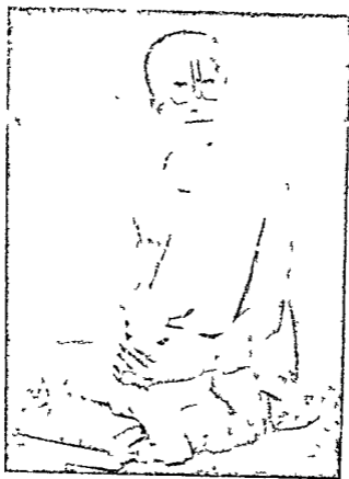
स्वामी ललित कृष्ण जी महाराज